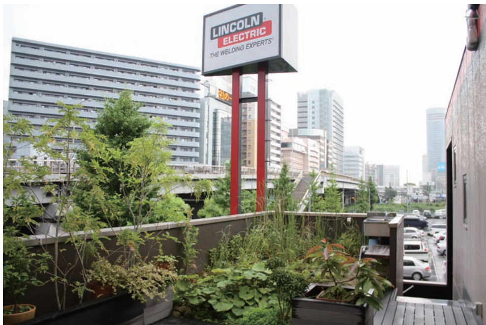
2Fバルコニーにあるビオトープです。季節ごとに様々な植物が楽しめます。