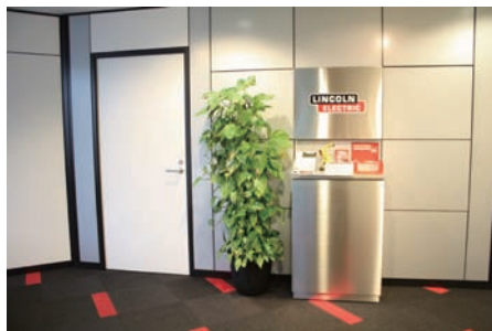
シャープなステンレスの看板とカウンターが印象を引き締めています。