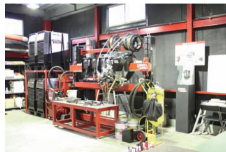
1Fショールーム、デモルームです。ここで溶接作業が体験できます。