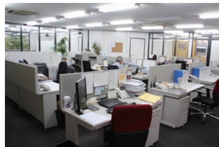
高さ40cmのデスクパネルが仕事に集中しやすい環境です。