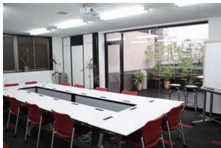
会議室は外部へ通じる全面ガラスがとても開放感があります。