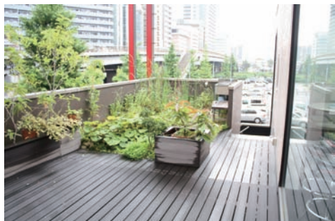
バルコニー手前はウッドデッキを敷いています。晴れた日は外で気持ちよくリフレッシュできます。