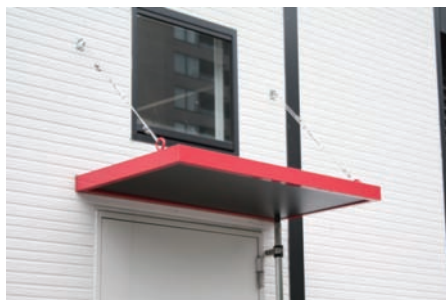
1F外部ヒサシです。リンカーン色でデザインしました。