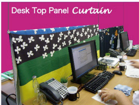
Desk Top Panel Curtain