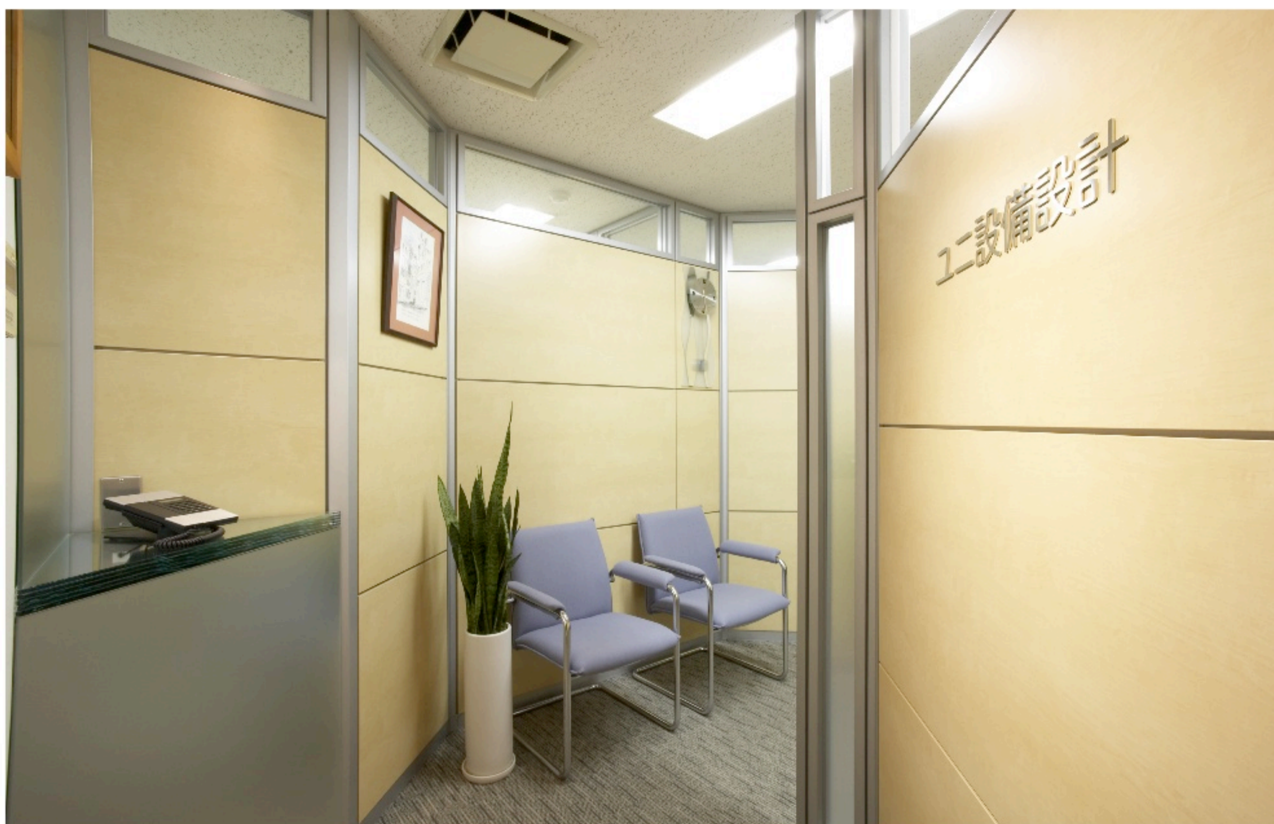
■ エントランスno.1 間仕切のコーナー(135°)が、とても印象的です。