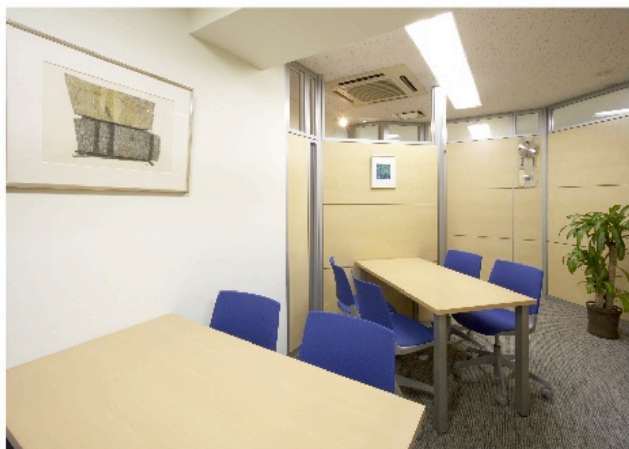
■ミーティング エントランスの裏側のスペースです。テーブル はスペースにあわせたサイズで特注しました。