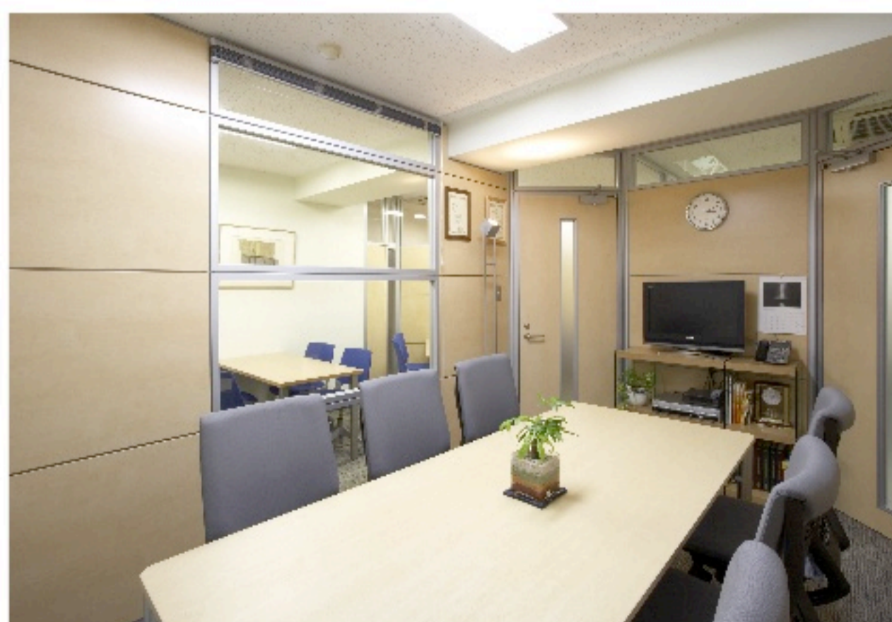
■ 会議室 ここにも間仕切の135°があります。薄い木目で 清潔感のある会議室になりました。